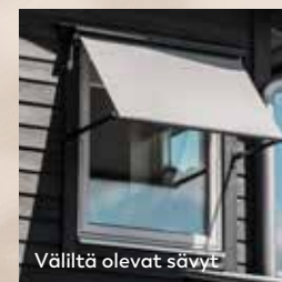
Väliltä olevat sävyt